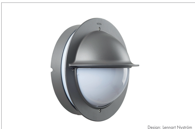
Design: Lennart Nyström