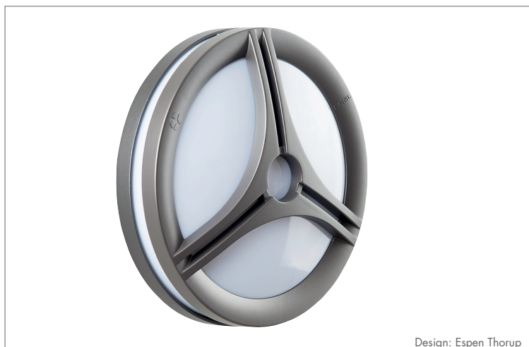
Design: Espen Thorup